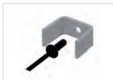
Manchon acier à riveter