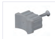
Manchon polyéthylène poteau rond