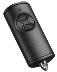
Roll'Auto RAL 9016